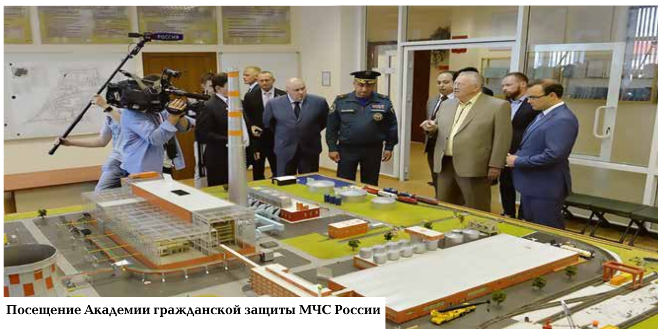
Посещение Академии гражданской защиты МЧС России