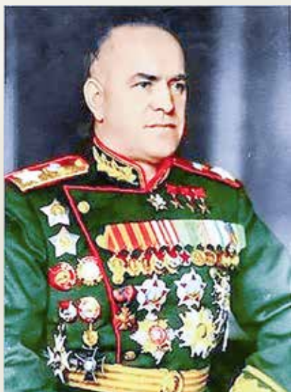
Георгий Константинович Жуков — Маршал Советского Союза, четырежды Герой Советского Союза, кавалер двух орденов «Победа», множества других советских и иностранных орденов и медалей