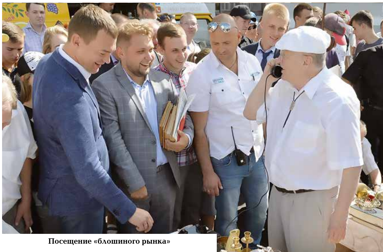
Посещение «блошиного рынка»