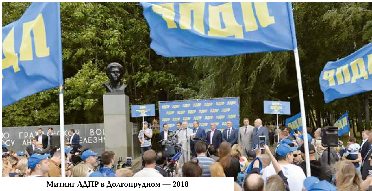
Митинг ЛДПР в Долгопрудном — 2018

Тридцатилетие ЛДПР, которое будет праздноваться в следующем году, — не партийный, а государственный праздник. Юбилей партии, которая сделала Россию Державой с большой буквы.