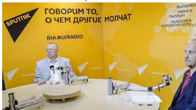
Посещение Радиокomiteта на Пятницкой