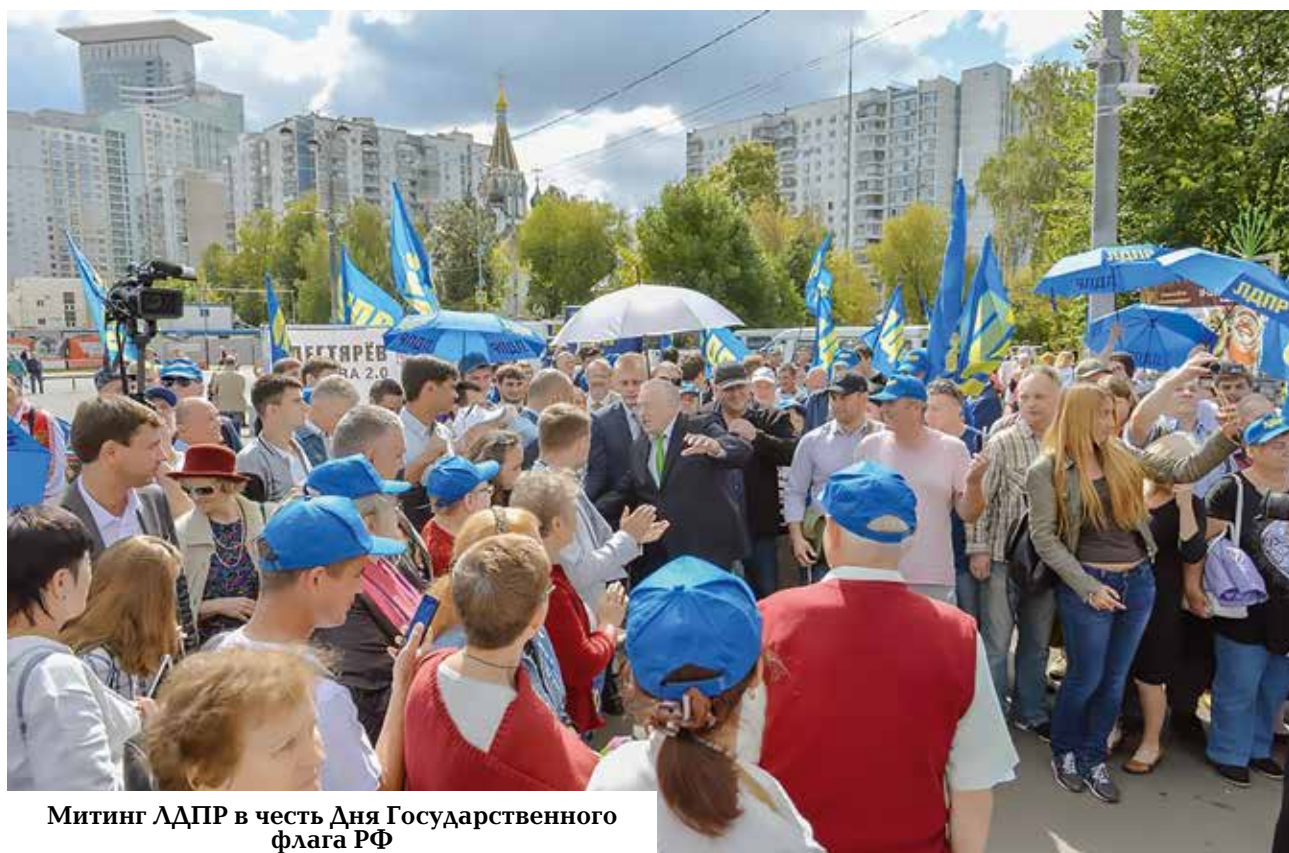
Митинг ЛДПР в честь Дня Государственного флага РФ