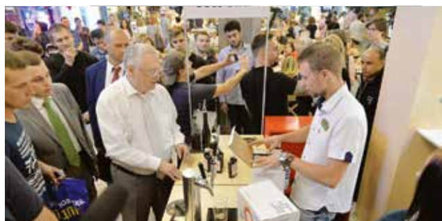
Посещение Центрального рынка в Москве