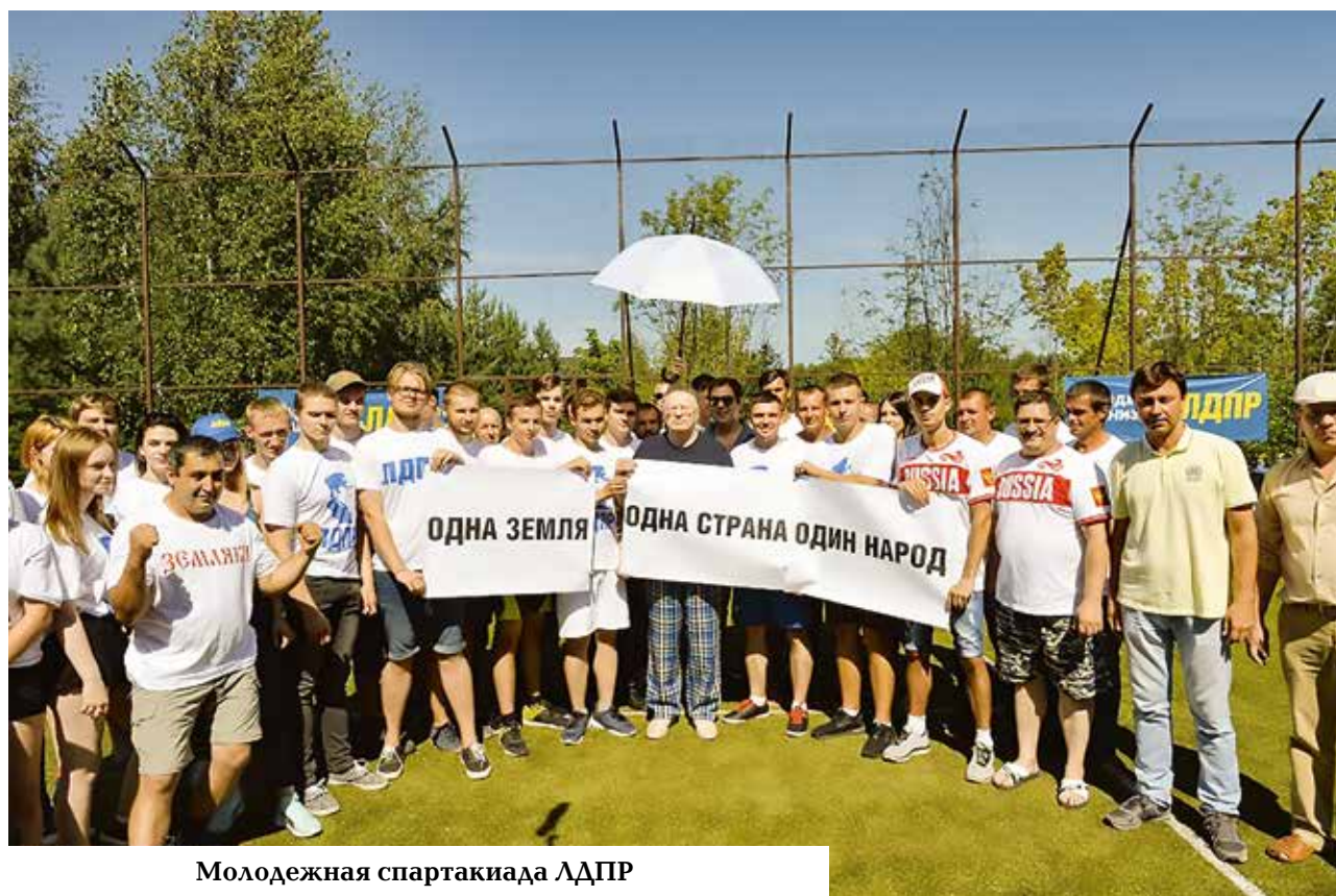
Молодежная спартакиада ЛДПР